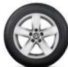
Corvara, 16, 15 palců sterlingové stříbro