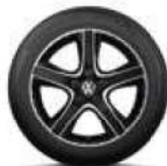
Dakar, 18 palců černá, leštěná