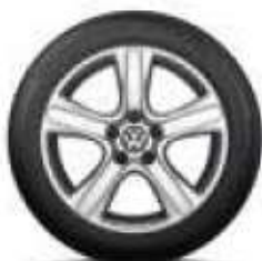
Dakar, 18 palců brilantní stříbrná