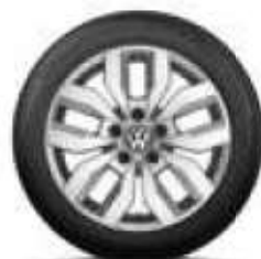
Rocadura, 17 palců brilantní stříbrná