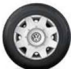
8paprskový design 16 palců