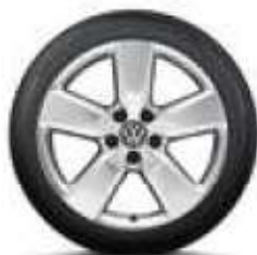
Aragonit, 19 palců brilantní stříbrná