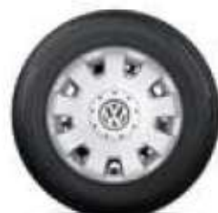
9paprskový design 15 palců