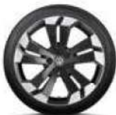
Nazaré, 20 palců metalíza Dark Graphite