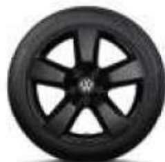
Aragonit, 19 palců černá