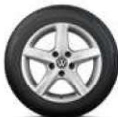
Aspen, 17, 16 palců brilantní stříbrná