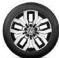
Rocadura, 17 palců černá, leštěná