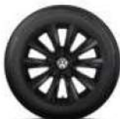
Durban, 18 palců černá, matná