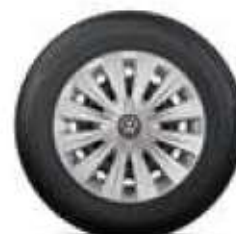
12paprskový design 15 palců