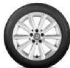
Merano, 17 palců brilantní stříbrná