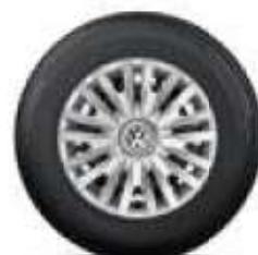
V design 15 palců