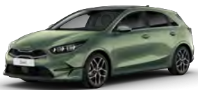
Zelená Experience (EXG)