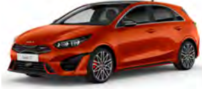
Oranžová Fusion (RNG) - pouze pro GT-line a GT