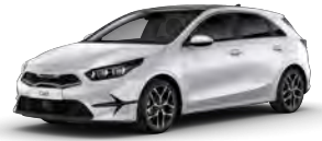
Perleťová Bílá Deluxe (HW2)