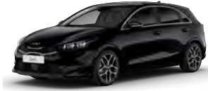
Perleťová Černá (1K)