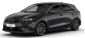
Šedá Penta Metal (H8G)