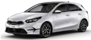
Perleťová Bílá Deluxe (HW2)