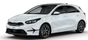
Bílá Cassa (WD) - není dostupná pro GT