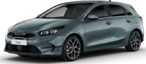
Šedá Yucca Steel (USG)