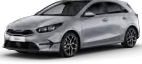
Stříbrná Sparkling (KCS)