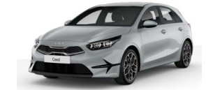
Šedá Wolf (WAF)