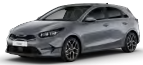
Stříbrná Lunar (CSS)