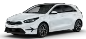
Bílá Cassa (WD)