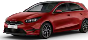
Červená Infra (AA9)