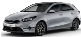
Stříbrná Sparkling (KCS) - není dostupná pro GT-line a GT