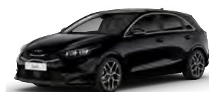
Perleťová Černá (1K)