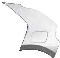
Šedá Steel (KLG)