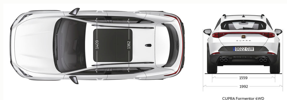
CUPRA Formentor 4WD